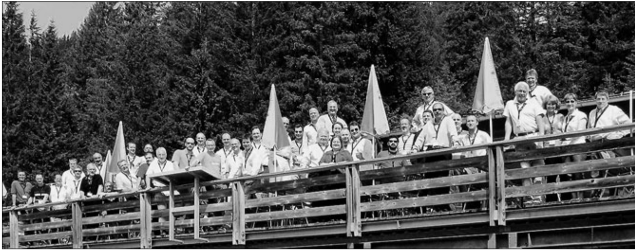
Das internationale Teilnehmerfeld am Seminar auf der Sonnenterrasse vom Ämpächli.

Die in der Automation von Rechenzentren tätige SMA Europe mit Sitz in Ziegelbrücke organisierte bereits zum vierten Mal ihren Kunden- und Weiterbildungsanlass im Glarnerland. Die einzigartige Umgebung und die perfekte Seminarinfrastruktur des Glarnerlandes überzeugte die rund 50 Teilnehmer aus elf Ländern ein weiteres Mal.